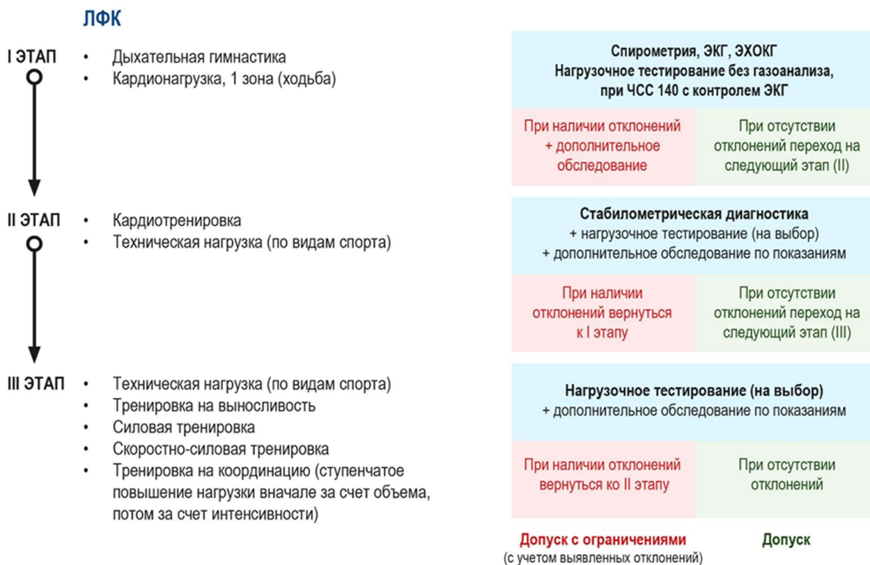
Рис. 2. Алгоритм восстановления тренировочной активности спортсмена после перенесенного COVID-19